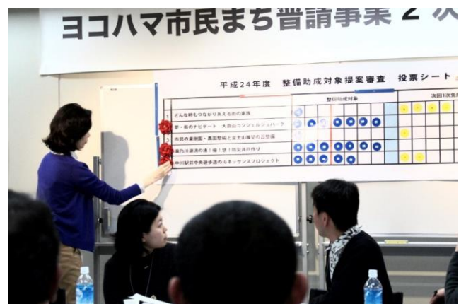
合格の赤いバラがつき、ヤッター！！