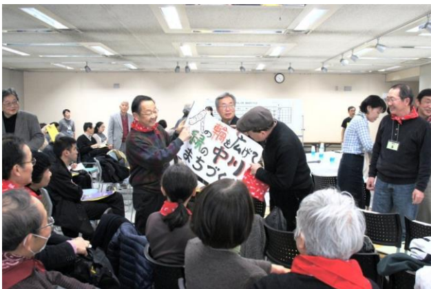
「人の輪を広げて緑の中川、まちづくり」のスローガンで応援