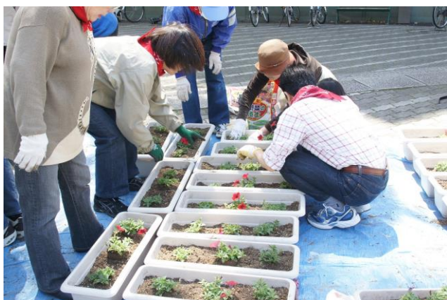
小さなプランターにも植えました