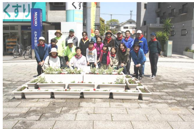
子供も参加し、花壇完成