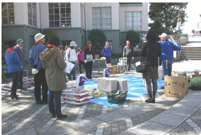
これからルネッサンスプロジェクト開始です

4月13日(土)、サントリーから提供されたサフィニア190株を使い、ふれあい広場センター花壇とくさぶえの道入口にプランターを設置しました。当日、NRPメンバーは9時に準備を開始し、10時には30人もの住民、事業者がふれあい広場に集合しました。プランターに腐葉土を入れ、サフィニア、ツルニチニチ草を植え、花壇を作りました。センター花壇は4m×3mの大きなもので、サフィニアが成長して赤い花を咲かせると、ふれあい広場は赤く華やかになるでしょう。