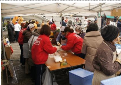
チームワークのいい地域ボランティアの皆さん