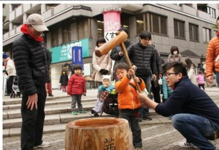
餅つき体験には長い列