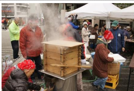
西小・中おやじの会は餅つきで大活躍