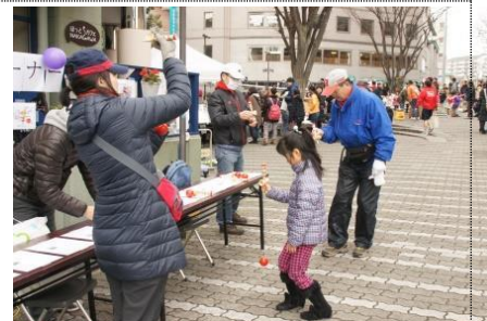
今流行のけん玉は集中力が勝負