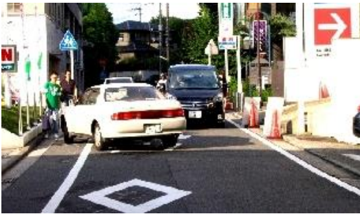
駐車場からの右折時