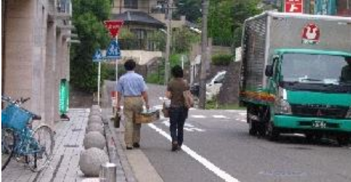
歩行者の通行の様子

8月18日(月)、都筑土木事務所は、横浜トヨペット側路肩に1.5m、反対側に0.3mの白線を引き、歩行者空間を作ることより、歩車分離を図りました。