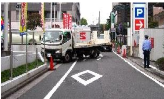
展示場に入る大型車