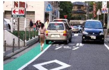
車のすれ違い時は～車がカラー歩道に侵入します