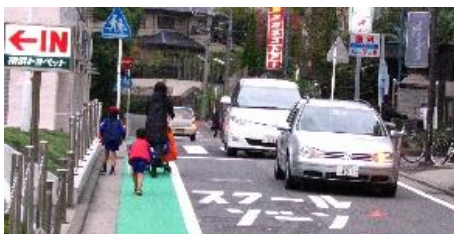
車が1車線走行である時歩行者は安全です