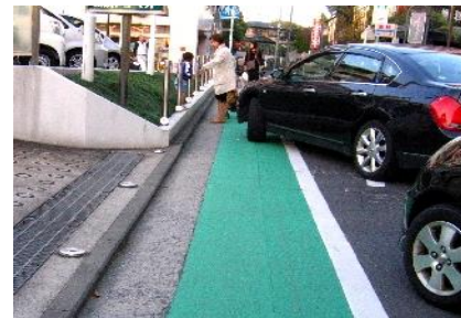
乳母車に車が2台も迫ります