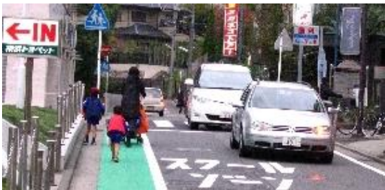
車が1車線走行のとき、歩行者は安全に通行できます。