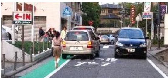
車のすれ違い時はグリーンベルトに車が侵入します。