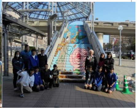
階段アートが完成しました