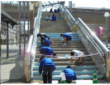
養生をして作業開始