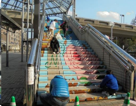
輪郭を描いていきます