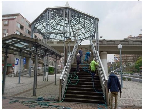
23年ぶりの階段水洗いをする NRP会のメンバー