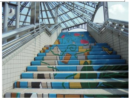
上段で見るアート