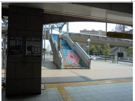
駅入り口からの風景