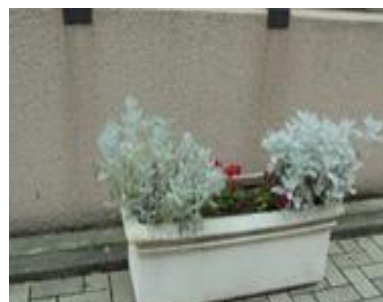
「ふれあい通り」にプランターが増えました