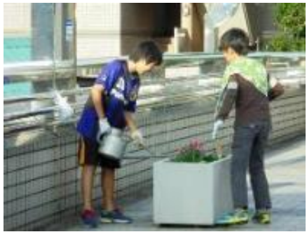
歩道橋上のプランターに散水