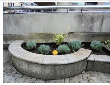
駅前広場にハーブ花壇完成