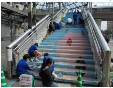
絵を描いていきます