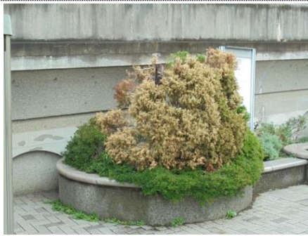
枯れたコニファを土木事務所が抜取り