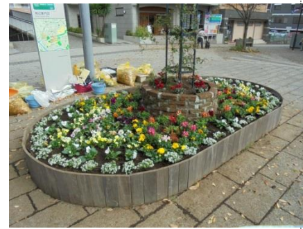
色鮮やかなシンボル花壇が完成

この花壇は、このまちを明るくきれいにするため、NRP の方と私たち NN ミニ POLICE31 がコラボして植えた花です。この町をみんなにきれいだとおもわれるようにみんなできれいなまちにしていきたいと思います。ご協力ありがとうございます。 (生徒が花壇に立てた立札より)