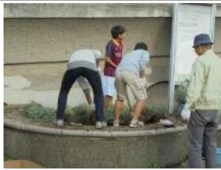
NRP の指導で土をならす男の子