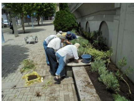
ほっとカフェの「囲碁サークル」の皆さんも参加して植え込み開始

6月28日(日)にハマロードサポーター、中川ルネッサンスプロジェクト会、ボランティアの皆さん10人が参加して、「駅前広場」と「ふれあい通り」の魅力アップ作業を行ないました。