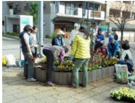
21 日も女の子 5 人が植え込みに参加