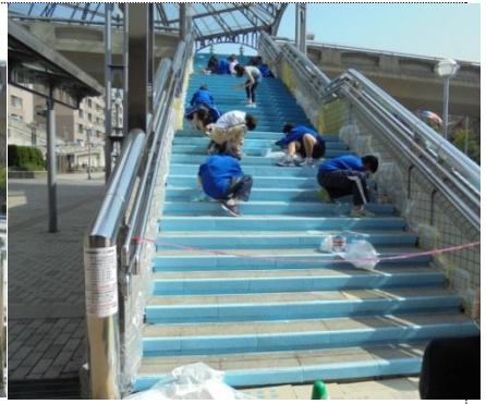
空のブルーを下地塗り