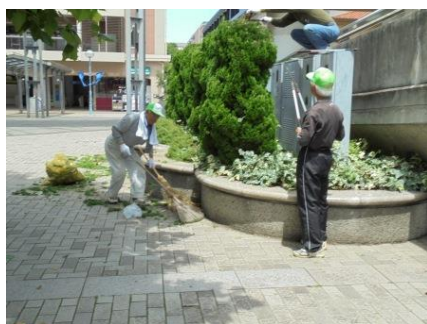
中川駅前商業地区振興会の皆さんは植木の剪定