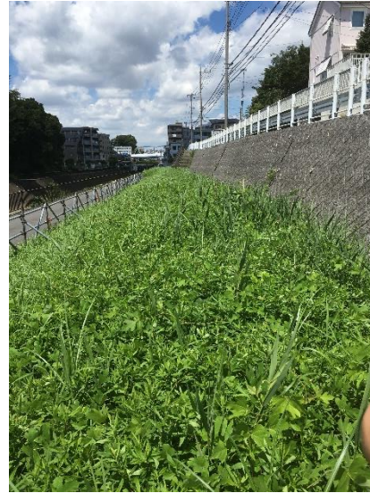
(2016年7月29日の早淵川・老馬谷ガーデン)

現地を初めて見たときは想像を遥かに上回る雑草でこんなところに公園を作ることがどういうことか想像すらできなかった。現地視察した当日は真夏の暑い日だった。しかしふとした瞬間に吹いた風がとても心地よかったことを今でも忘れられない。その瞬間自然を五感で感じる事が出来る公園が作れば良いなと思い、先生との相談を重ね風に揺られる草の音で自然を感じる事のできるサウンドガーデンを作ろうと決心した。音が聞こえることは目の不自由な方やお年寄りの方にも自然を感じてもらえる事が出来るのではとも考えた。また自分は昔ながらの“里”が大好きでこの要素を取り入れたいと思った。