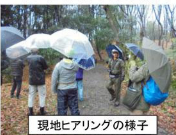
現地ヒアリングの様子

山崎公園内の里山は、緑の木々、貴重な野草がある地域資源です。しかし、笹等が生い茂り、樹木が枯れたりしています。そこで、都筑土木事務所は、緑税を活用し、樹林地保全活動を行うことにしました。