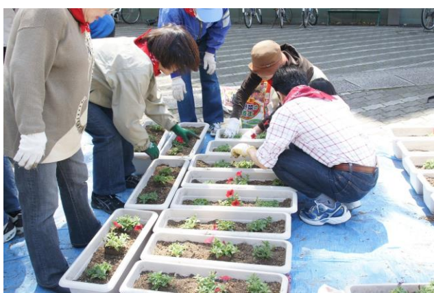
小さなプランターにも植えました