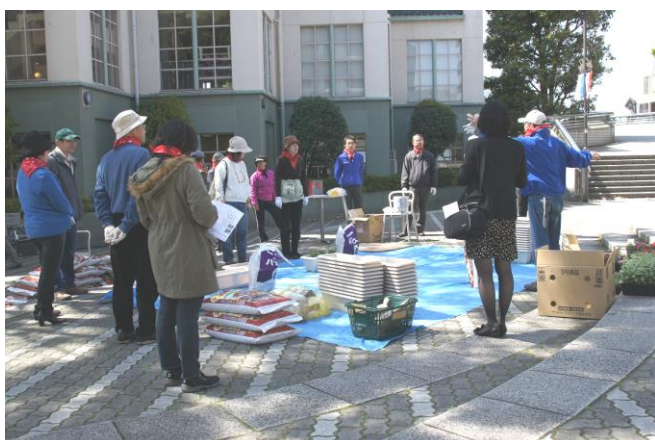
これからルネッサンスプロジェクト開始です

4月13日(土)、サントリーから提供されたサフィニア190株を使い、ふれあい広場センター花壇とくさぶえの道入口にプランターを設置しました。当日、NRPメンバーは9時に準備を開始し、10時には30人もの住民、事業者がふれあい広場に集合しました。プランターに腐葉土を入れ、サフィニア、ツルニチニチ草を植え、花壇を作りました。センター花壇は4m×3mの大きなもので、サフィニアが成長して赤い花を咲かせると、ふれあい広場は赤く華やかになるでしょう。