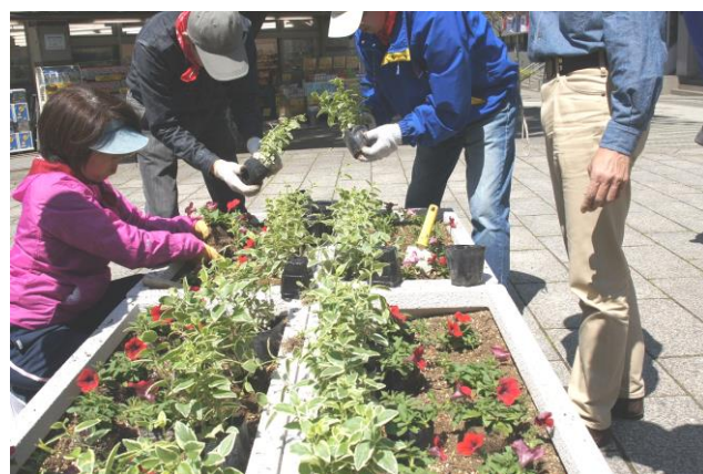
大きなプランターに植えました