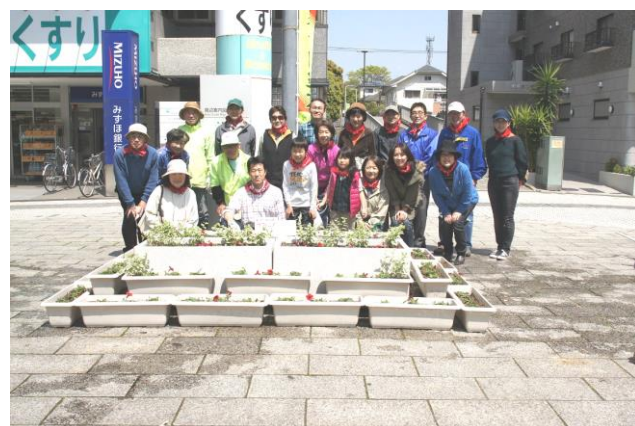
子供も参加し、花壇完成