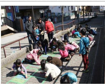
西小生徒等がケンパー歩道の絵かき

中川西中学校美術部の皆さんが、3月21日(金)・22日(土)の2日かかりで、駅前交番の横にある歩道橋の階段に絵を描いてくれました。中川駅前商業地区のメインストリートは、駅前階段の上にあります。初めて中川に来た人には、その存在がわかりません。そこで、階段に絵を描いて、花壇やステージのある「花と香りのみち」や「ステージ広場」に案内することにしました。絵の名前は「Welcome」。昨年12月から美術部の活動時間にデザインしてきました。風が強い中、階段清掃、アウトライン描き、下塗り、下絵描き、ペンキが壁に付かないよう養生、アクリルペンキで色塗り、仕上げ、延べ30人のチームワークでおしゃれな絵が完成。絵の中にある木は、本物の木につながっています。