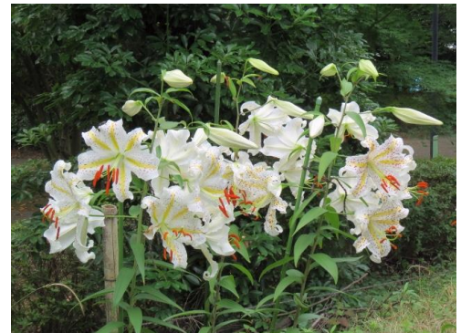
小学校の畑に咲いた「ヤマユリ」