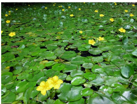
小さい池一面の「アサザ」

ヤマユリ再生プロジェクトは8年目を迎えました。畑やプランターでなく、林床に自然の状態に根付いてくれるまでには、まだまだ試行錯誤が続きます…。