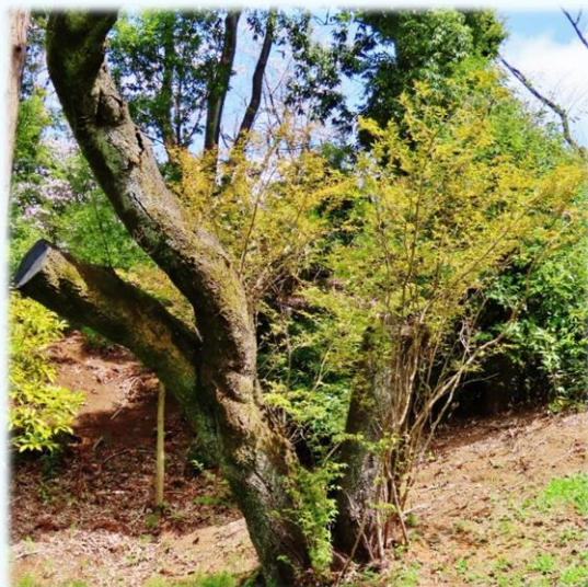
脇に出た若木にも 花が付きました