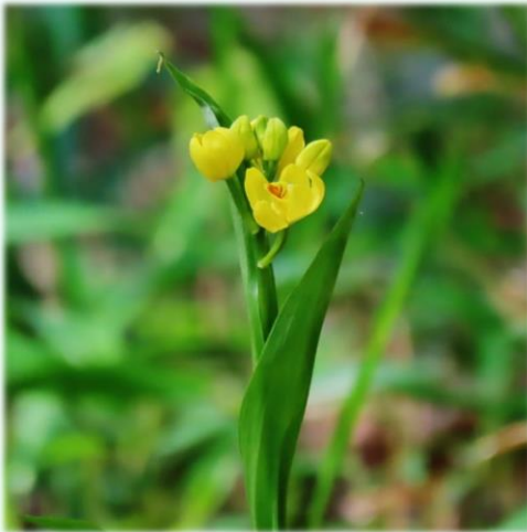
キンラン/ラン科キンラン属

野草のこみち や 野草観察路 で 金欄(キンラン) の つぼみが膨らみ 夏灯台(ナツウダイ) が 見ごろを迎え 宝鐸草(ホウチャクソウ) も 咲き始めました