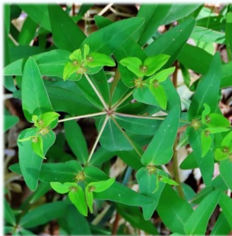
ナツウダイ/トウダイグサ科