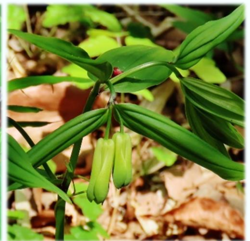
ホウチャクソウ/イヌサフラン科

一薬草(イチヤクソウ) と 筆竜胆(フデリドウ) が 復活! ? 親水広場上の尾根道で 一薬草が発芽し 筆竜胆が咲きました