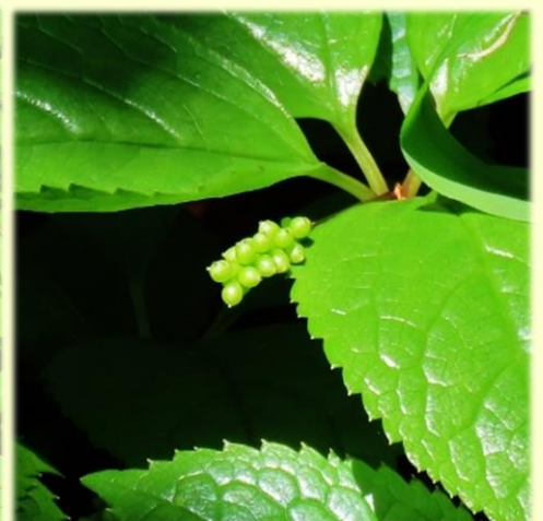
小さい実をつけた一人静