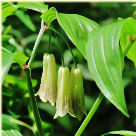
宝鐸草はこれで満開