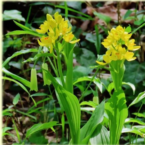
満開の 宝鐸草 と