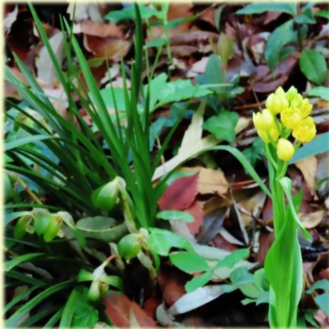
見納めの 春蘭 と