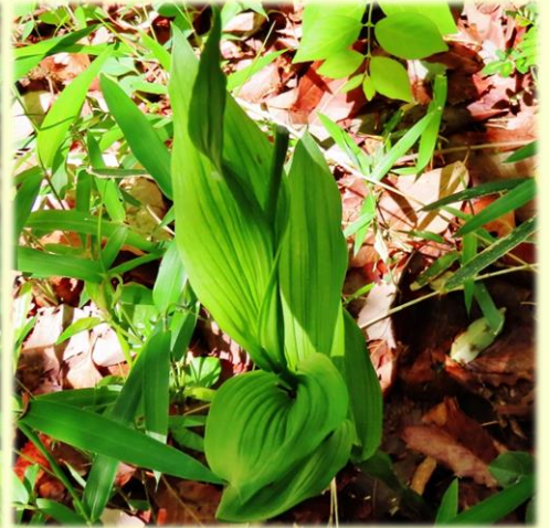
無残に切り取られた 金蘭